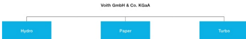
Organisationsstruktur Konzernbereiche der Voith Group

Der frühere Konzernbereich Digital Ventures wurde im Berichtsjahr als konzernübergreifende Funktion in der Konzernholding angesiedelt und wird nicht mehr als gesonderter Konzernbereich geführt. Die bisherigen Aufgaben von Digital Ventures – die Entwicklung digitaler Angebote und Services für Kunden, einschließlich der Venture-Aktivitäten, die digitale Transformation des Konzerns selbst sowie die konzernweite IT – werden innerhalb der neu geschaffenen Zentralfunktion „Innovation & Technology“ fortgeführt und weiterentwickelt. Die Konzernbereiche Hydro, Paper und Turbo zeichnen nach wie vor für die Vermarktung der digitalen Angebote und Services verantwortlich.