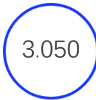
Addetti del Gruppo